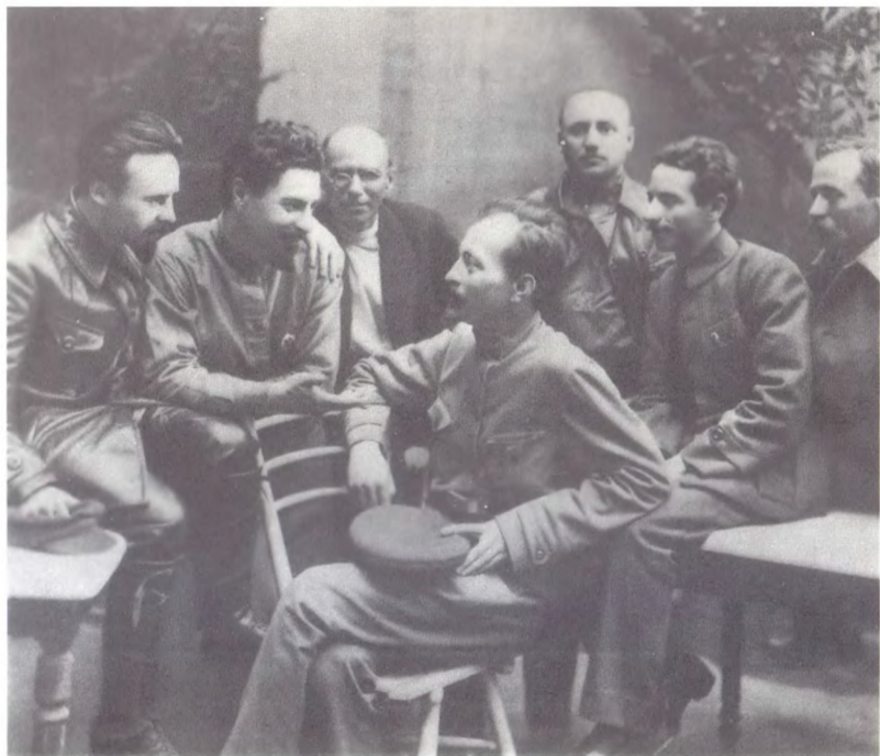
Ф. Э. Дзержинский среди ответственных работников ВЧК. 1919 г.