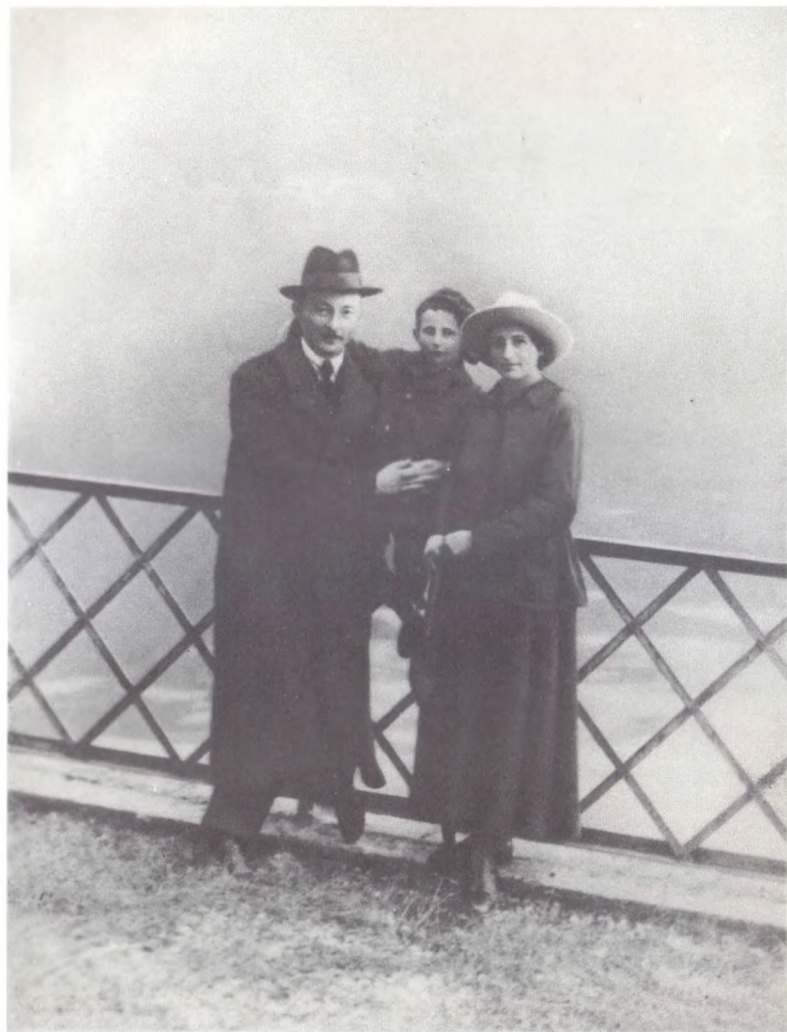
Ф. Э. Дзержинский с женой С. С. Дзержинской и сыном Яном. Лугано (Швейцария). Октябрь 1918 г.