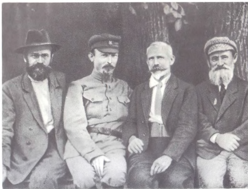
Ф. Э. Дзержинский, Ю. Ю. Мархлевский и Ф. Я. Кон — члены Временного революционного комитета Польши. Первый слева И. И. Скворцов-Степанов. 1920 г.