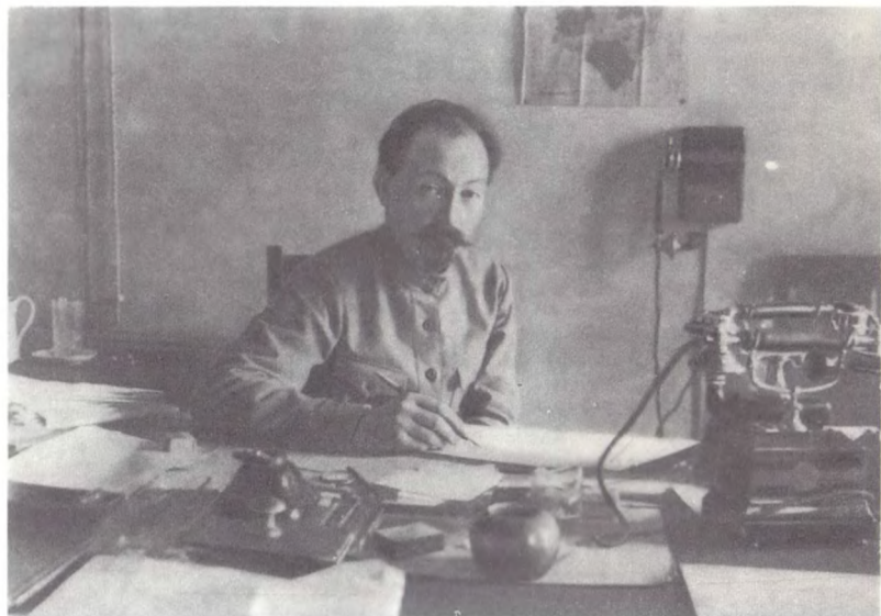
Ф. Э. Дзержинский — нарком путей сообщения — в рабочем кабинете. 1921 г.