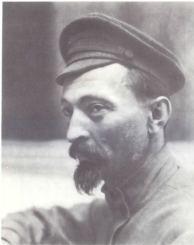
Ф. Э. Дзержинский. 1919 г.