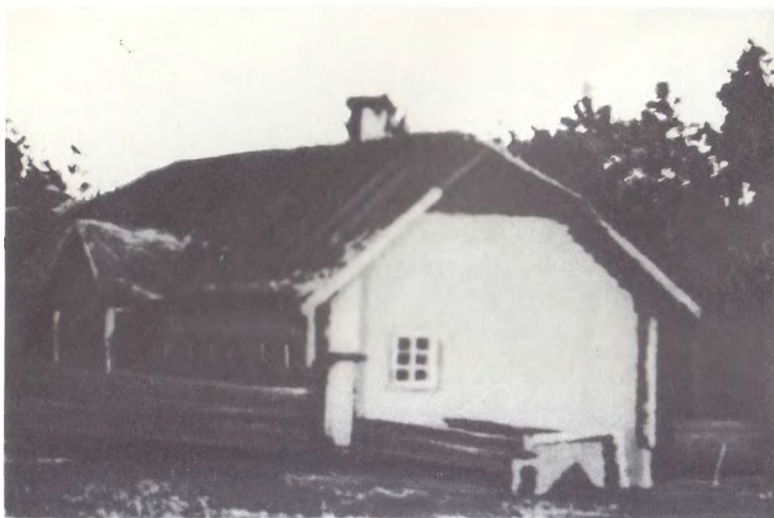
Дом в Дзержиново, в котором родился Ф. Э. Дзержинский 11 сентября (30 августа) 1877 г.

Ф. Э. Дзержинский с матерью Е. И. Дзержинской и братьями Казимиром и Станиславом на крыльце дома в местечке Иоде Виленской губернии — имени бабушки Янушевской. 1889 г.