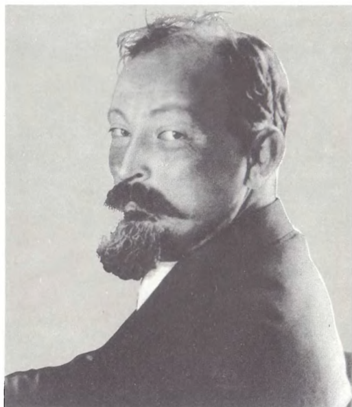
Ф. Э. Дзержинский. 1926 г.