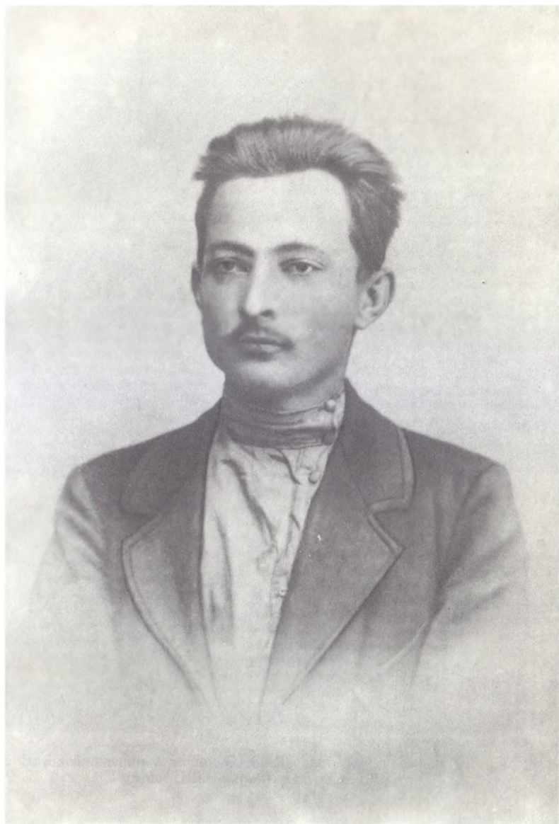
Ф. Э. Дзержинский в Седлецкой тюрьме. 1901 г.