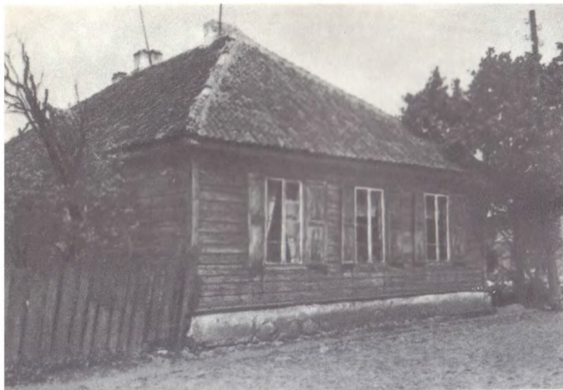
Флигель при доме бабушки Янушевской, где на чердаке Феликс Дзержинский скрытно печатал на гектографе подпольные издания. Вильно. 1895—1896 гг.

Дом Миллера в г. Вильно (в Заречье), в мансарде которого жил Ф. Э. Дзержинский и где собирались его друзья-подпольщики. 1896 г.