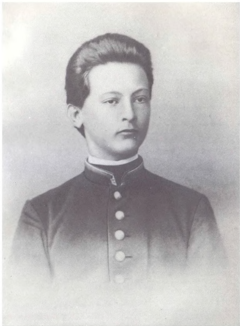
Ф. Э. Дзержинский. 1894 г.