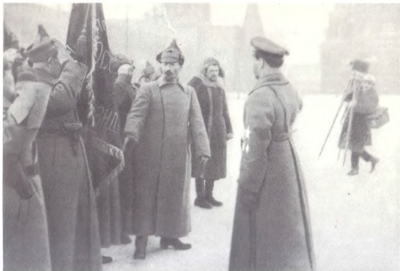
Ф. Э. Дзержинский при вручении Почетного знамени Президиума ВЦИК полку ВЧК на Красной площади в Москве. 1921 г.