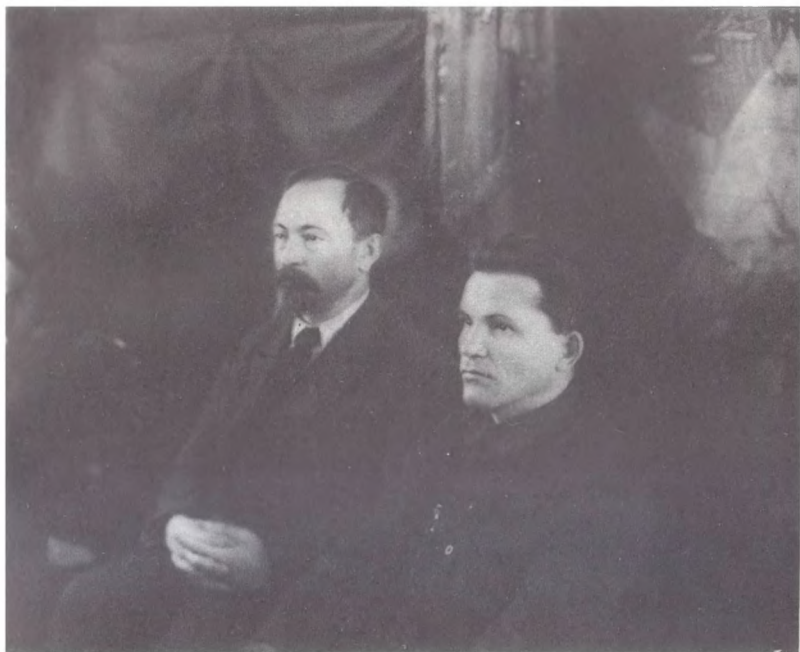
Ф. Э. Дзержинский и С. М. Киров на заседании XXIII Чрезвычайной Ленинградской губернской конференции ВКП(б). Февраль 1926 г.