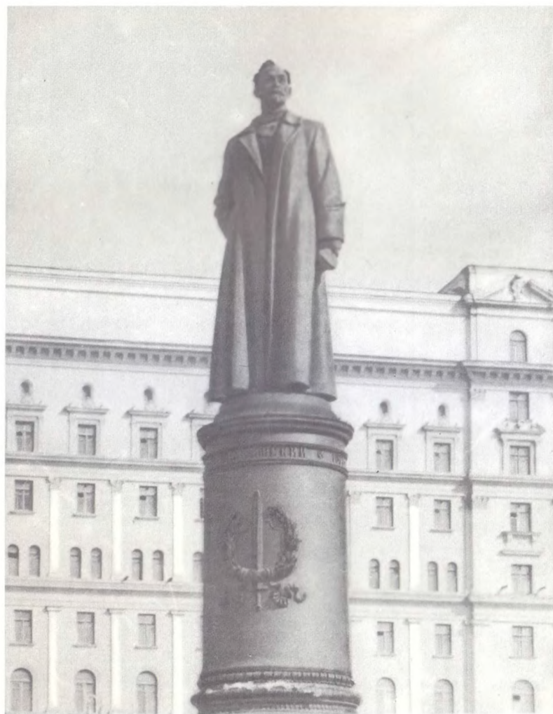
Памятник Ф. Э. Дзержинскому на площади Дзержинского в Москве.