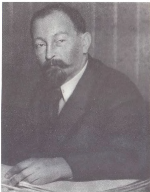
Ф. Э. Дзержинский. 1925 г.