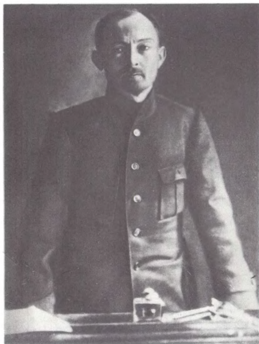
Ф. Э. Дзержинский в Орловском центре. 1914 г.