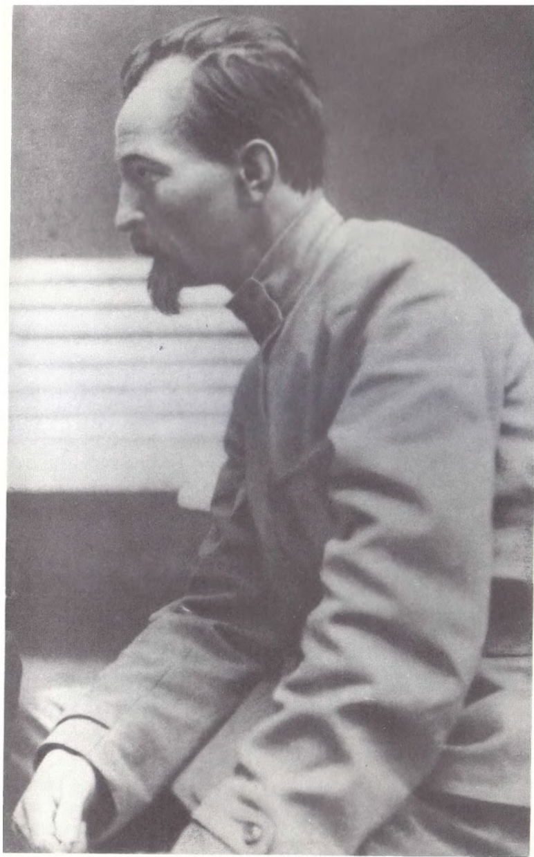
Ф. Э. Дзержинский. 1919 г.