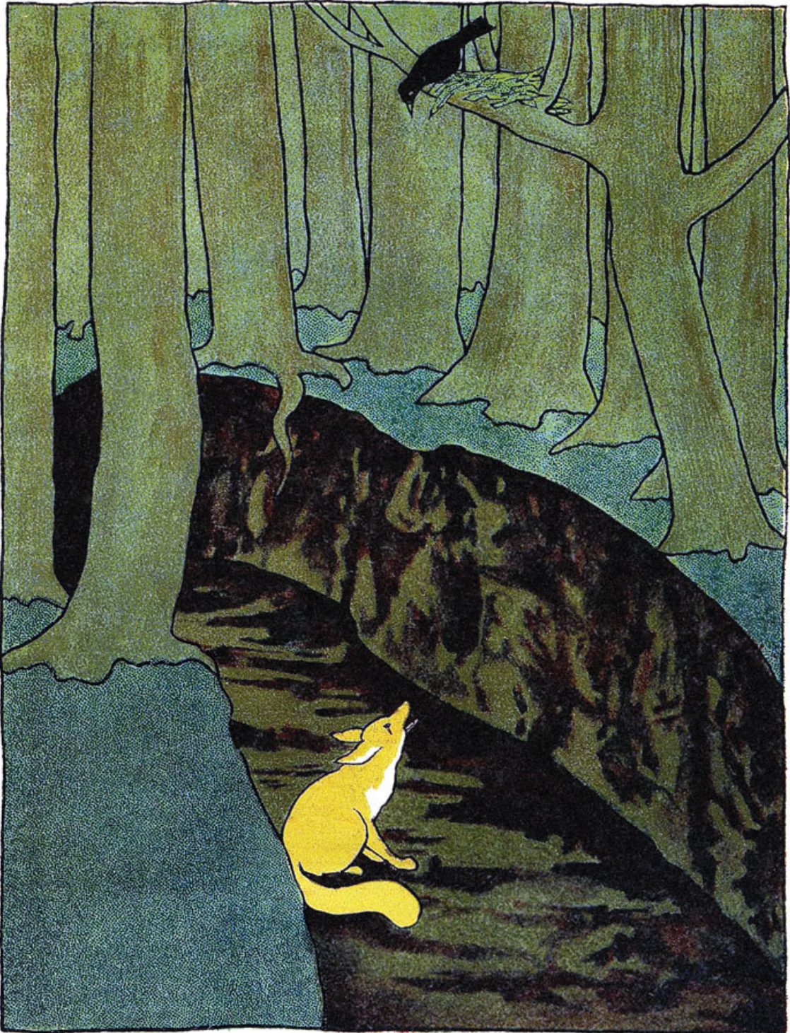
Иллюстрация к сказке «Мужик, медведь и лиса». Художник А. Медведев

Над этой ямой стояло древо, на этом древе вил дрозд гнездо. Лисица сидела, сидела в яме, всё на дрозда смотрела и говорит ему: «Дрозд, дрозд, что ты делаешь?» – «Гнездо вью». – «Для чего ты вьёшь?» – «Детей выведу». – «Дрозд, накорми меня, если не накормишь – я твоих детей поем».