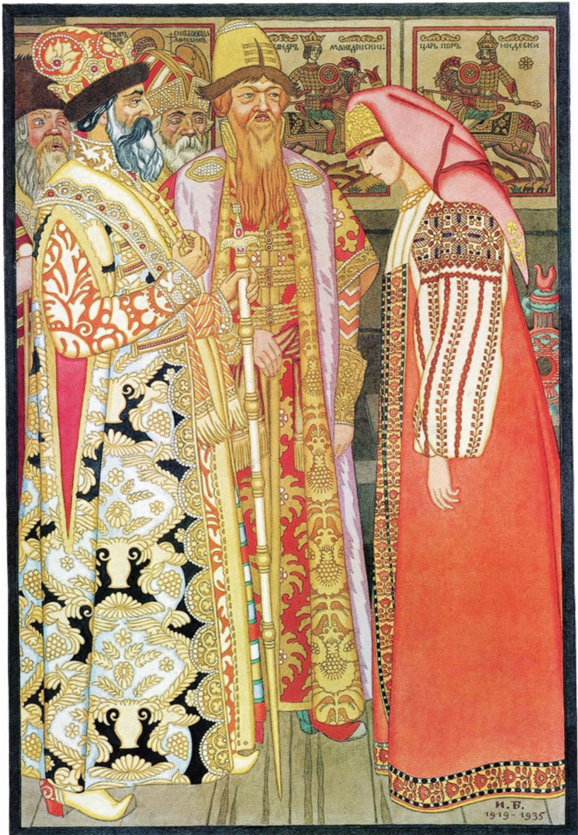
Иллюстрация к сказке «Пойди туда – не знаю куда, принеси то – не знаю что». Художник И. Билибин