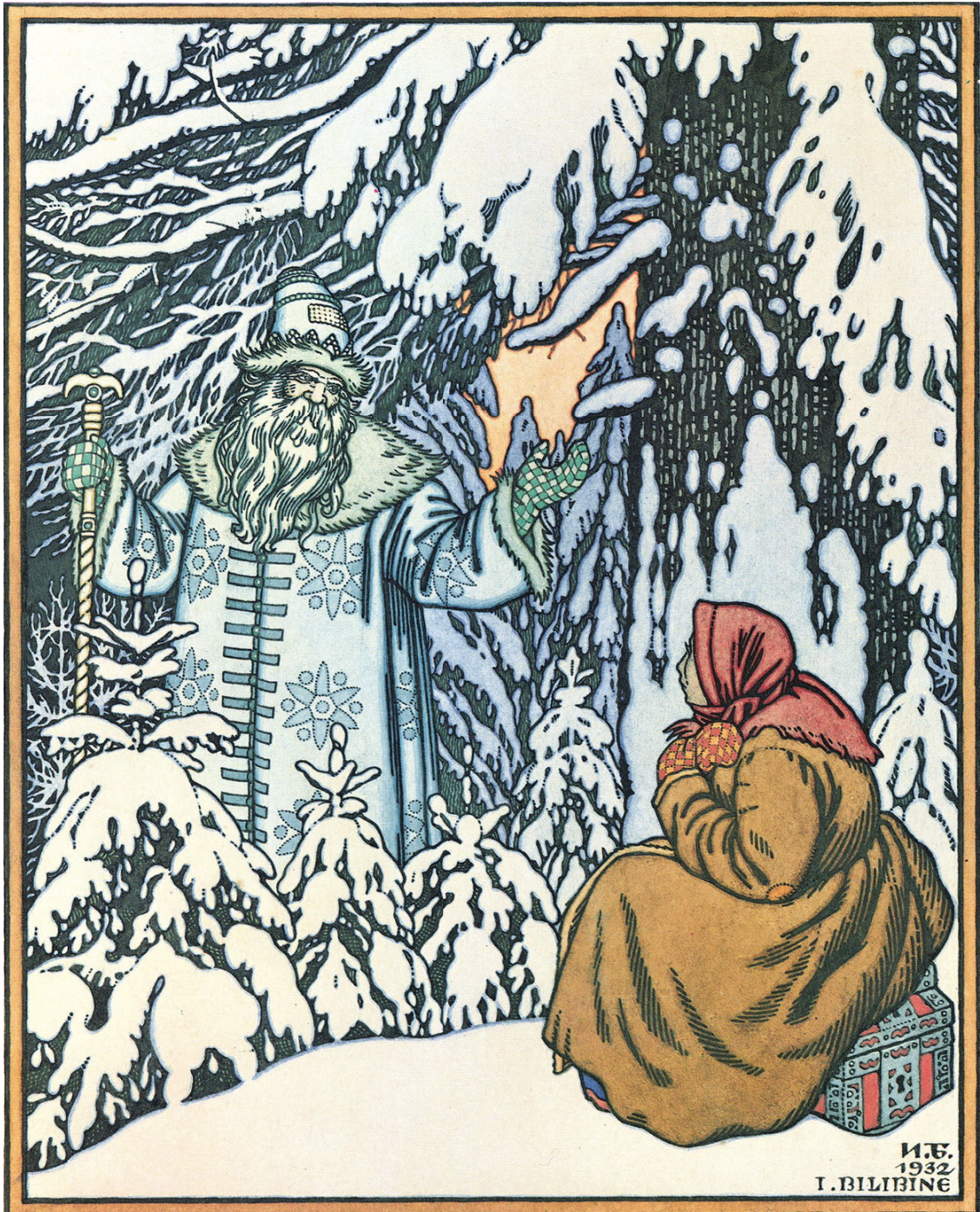
Иллюстрация к сказке «Медведь». Художник В. Нарбут

Девушка сидит да дрожит; озноб её пробрал. Хотела она выть, да сил не было: одни зубы только постукивают. Вдруг слышит: невдалеке Морозко на ёлке потрескивает, с ёлки на ёлку поскакивает да пощёлкивает.