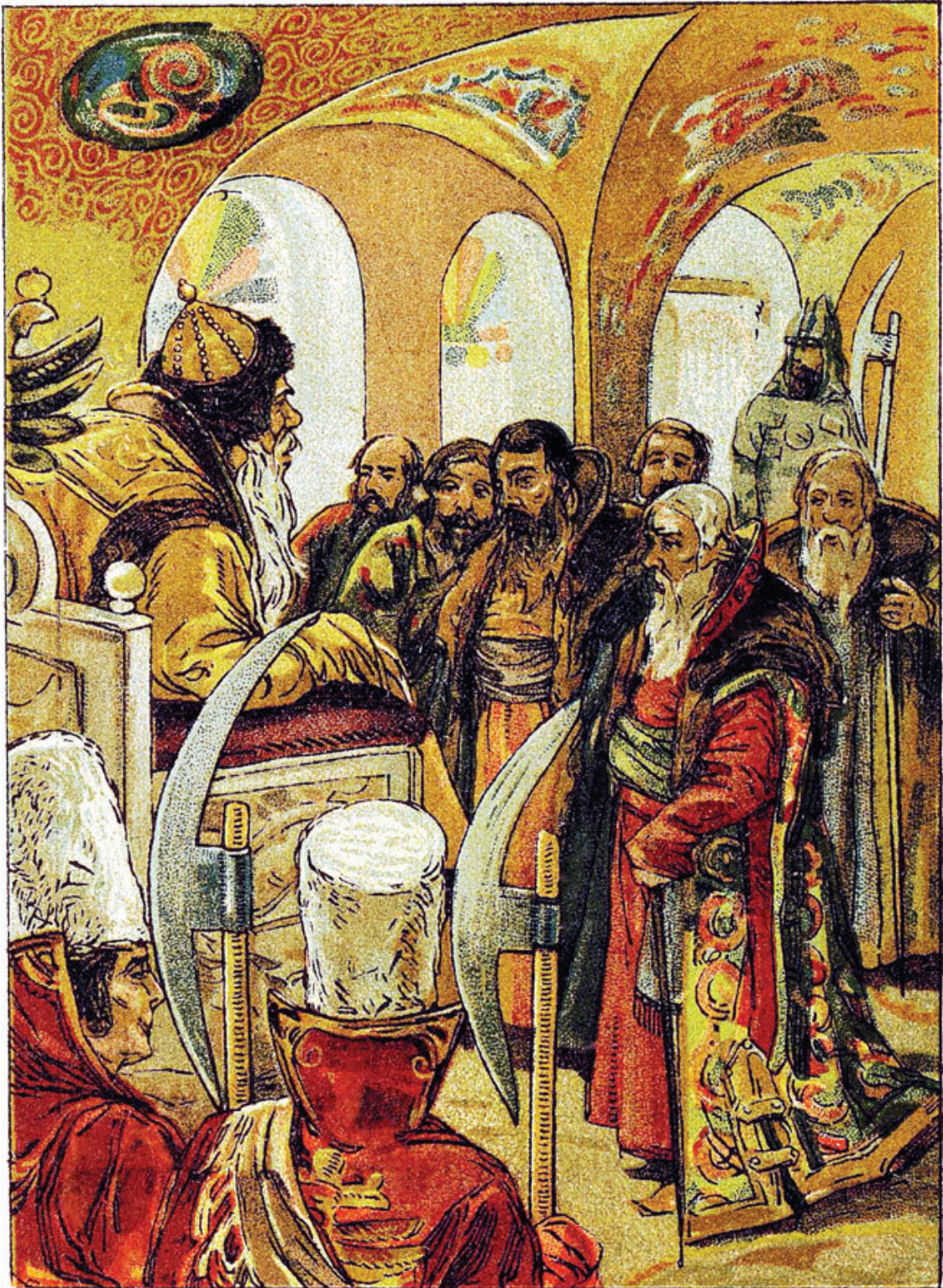
Иллюстрация к сказке «Василий Буславич». Художник Н. Каразин

Один, слышь, царь велел созвать со всего царства всех, сколь ни есть, бар, всех-на-всех к себе, и вот этим делом-то заганул им загадку: «Нуте-ка, кто из вас отганёт? Загану я вам загадку: кто на свете лютей и злоедливей, – говорит, – всех?»