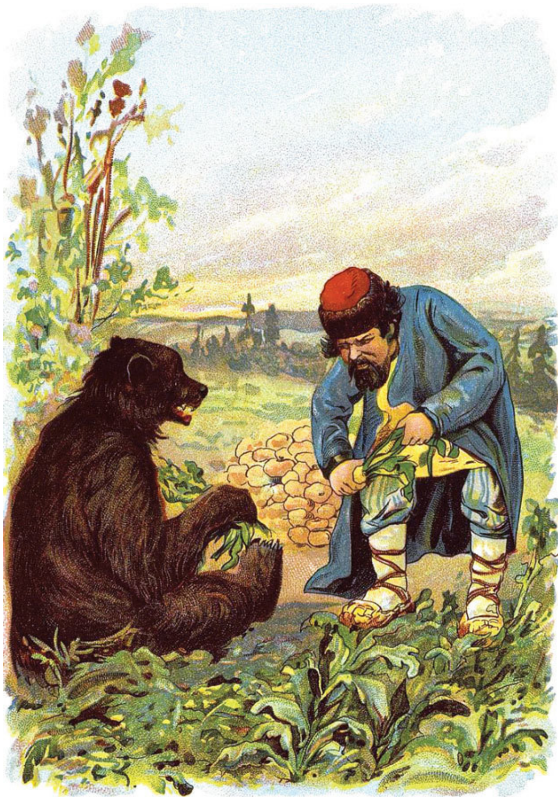
Иллюстрация к сказке «Мужик, медведь и лиса». Художник А. Медведев

Выросла у них репа; мужик взял себе корешки, а Миша верхки.