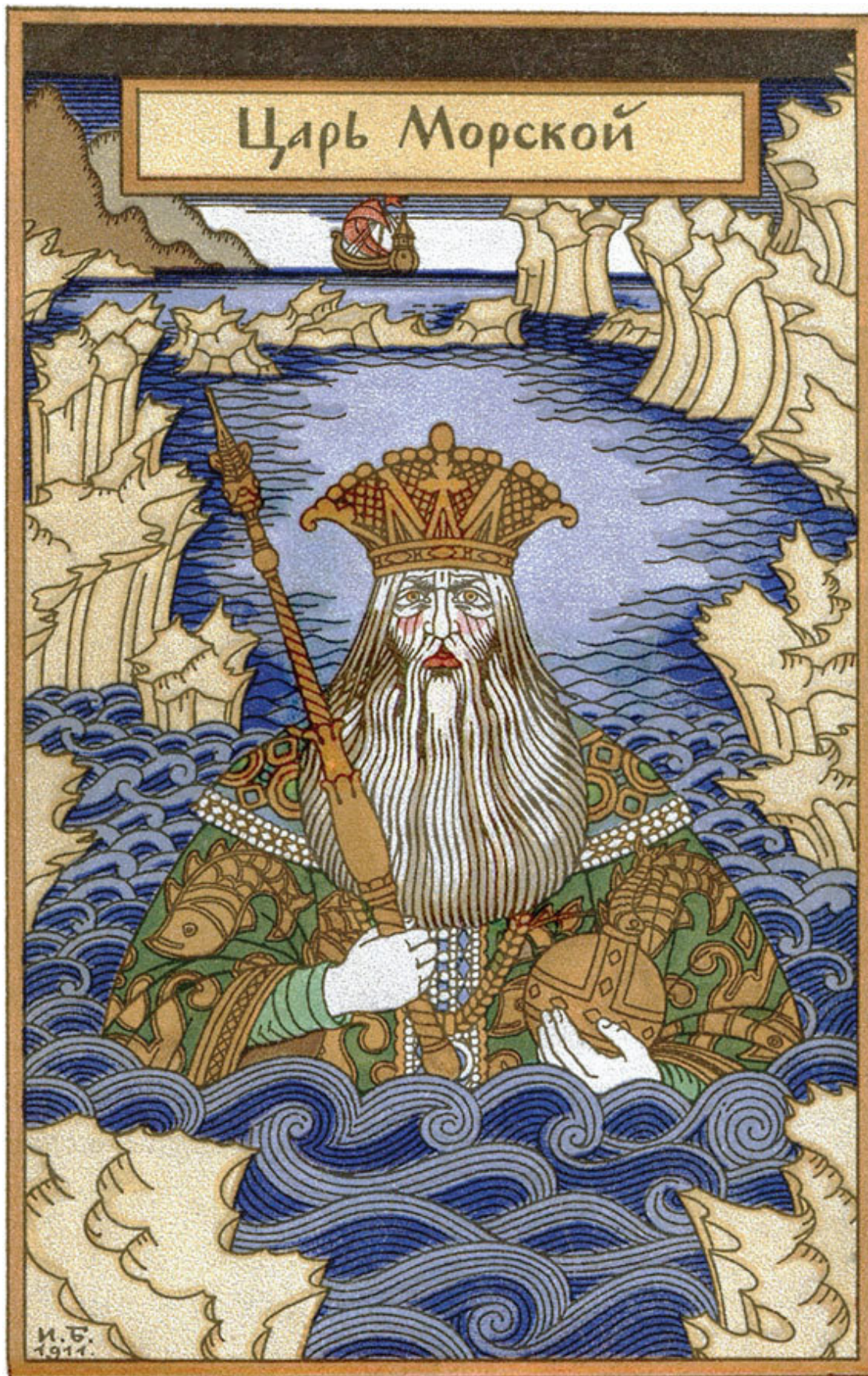
Иллюстрация к сказке «Морской царь и Василиса Премудрая». Художник И. Билибин