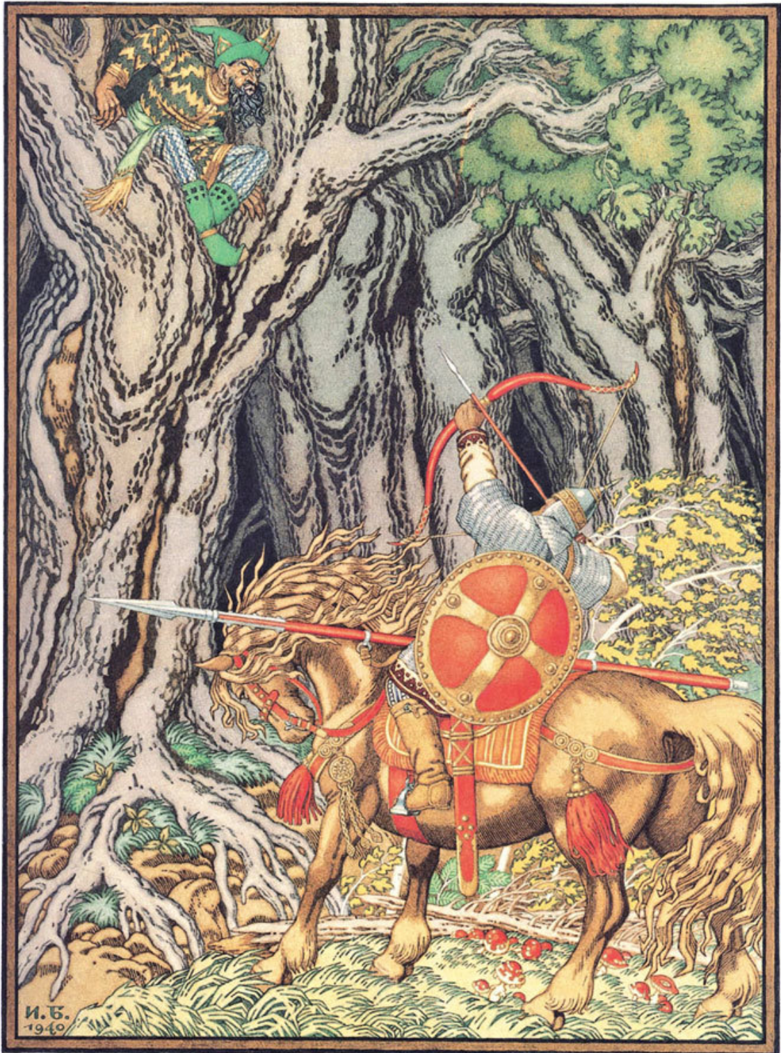
Иллюстрация к сказке «Горе». Художник Э. Лиснер

Влезло Горе в колесо; купец взял да и с другого конца забил во втулку дубовый клин, поднял колесо и забросил его вместе с Горем в реку. Горе потонуло, а купец стал жить по-старому, по-прежнему.